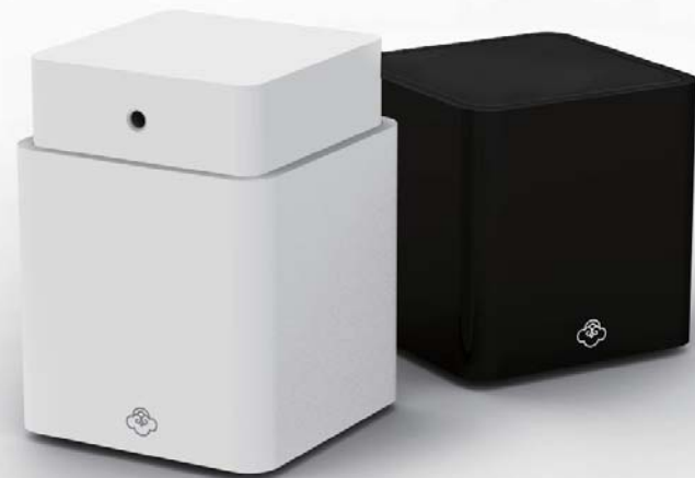
Cube Diffuseur de parfum